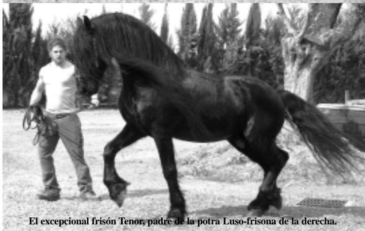
El excepcional frisón Tenor, padre de la potra Luso-frisona de la derecha.