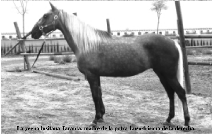
La yegua lusitana Taranta, madre de la potra Luso-frisona de la derecha.